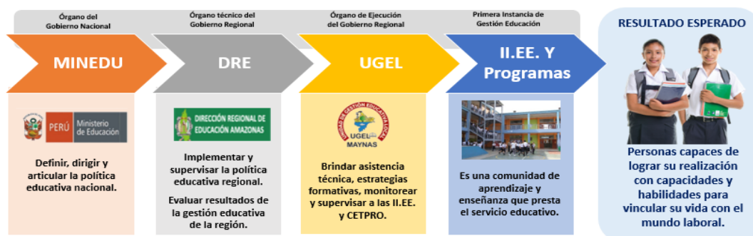
Gráfico N° 01 Organización del Sistema Educativo Peruano